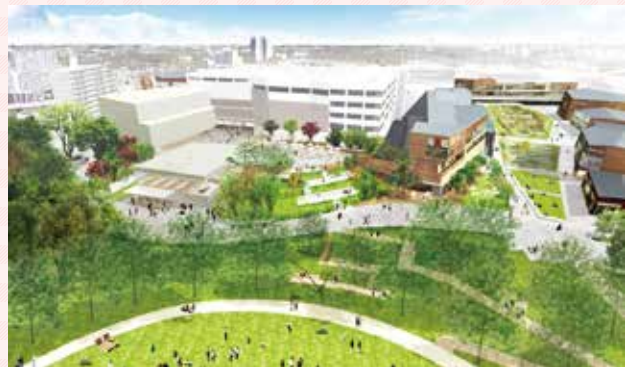
新しいまちのイメージ図