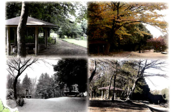
展望広場「六角亭」付近の四季