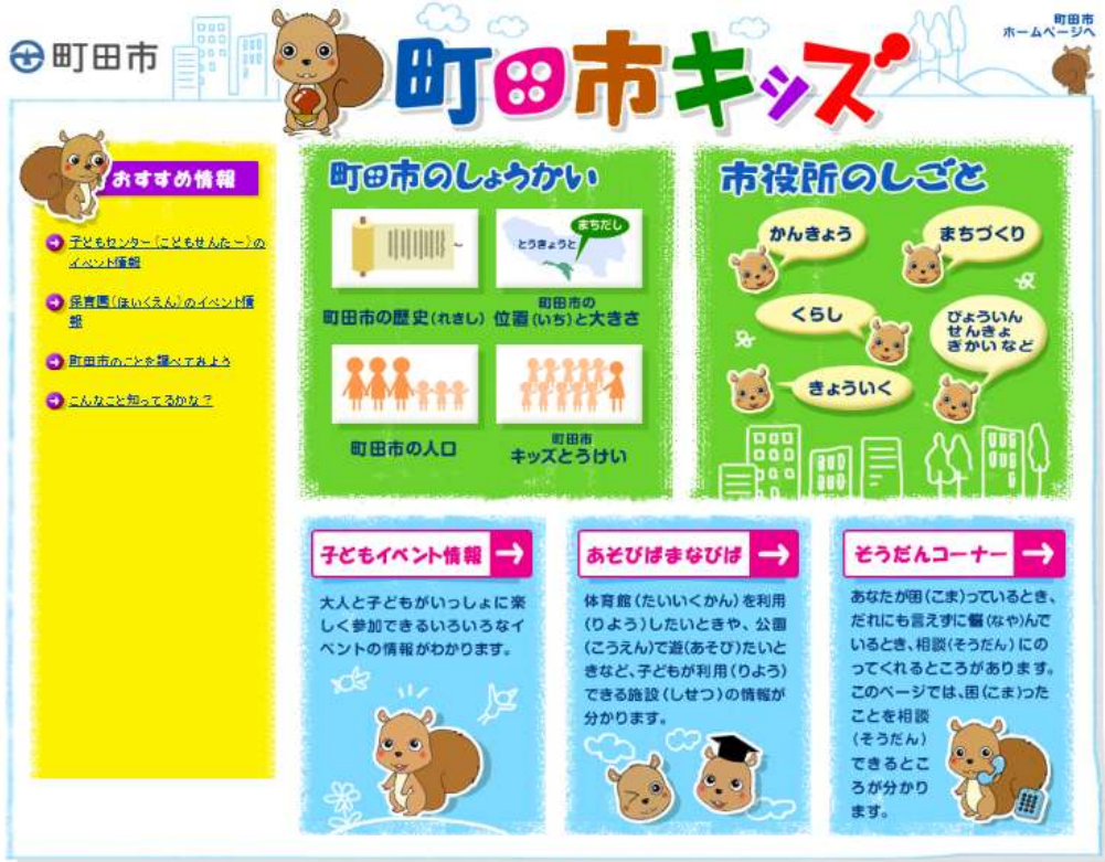
町田市役所：電話 042-722-3111(代表) 〒194-8520 東京都町田市森野2-2-22 窓口受付時間 午前8時30分～午後5時 Copyright Machida city. All rights reserved.

町田市のしょうかい の、町田市キッズとうけい のページでは、土地、気候、人口など10種類の統計情報を、グラフや図を交えて子ども向けにわかりやすく紹介しています。