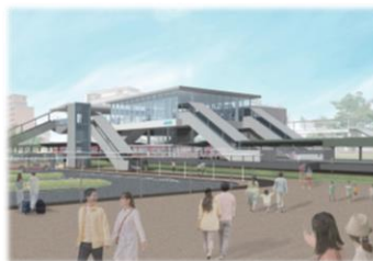
橋上化した鶴川駅