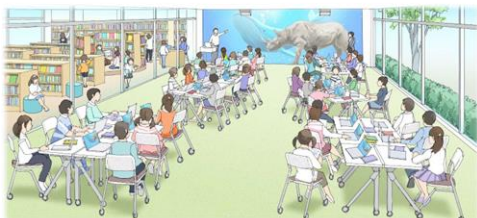
ラーニングセンター

教室にホワイトボードを設置し、板書だけでなく、教材等の投影やICTを活用した学習ができるようにします。また、多様なメディアを活用し、子どもたちが話し合い、学習することができるラーニングセンターを整備します。