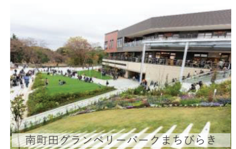
南町田グランベリーパークまちびらき