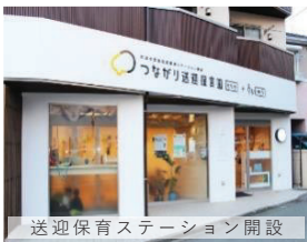
送迎保育ステーション開設