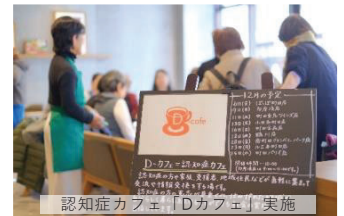
認知症カフェ「Dカフェ」実施