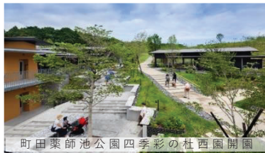
町田薬師池公園四季彩の杜西園開園