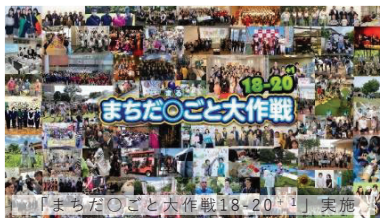
「まちだ〇ごと大作戦18-20」実施