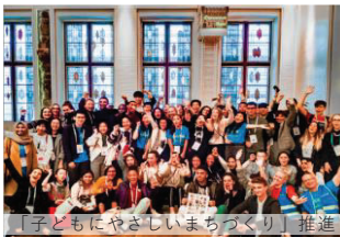
「子どもにやさしいまちづくり」推進