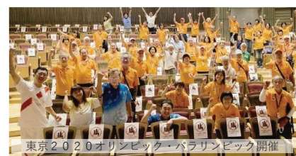
東京2020オリンピック・パラリンピック開催