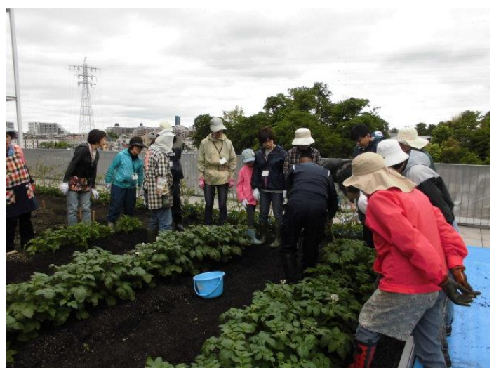
ジャガイモの苗の追肥