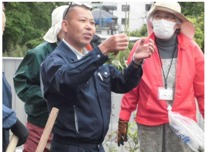
サツマイモの植え付け説明