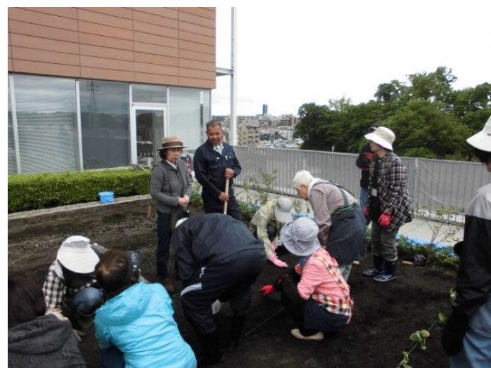
ニンジンの種まき