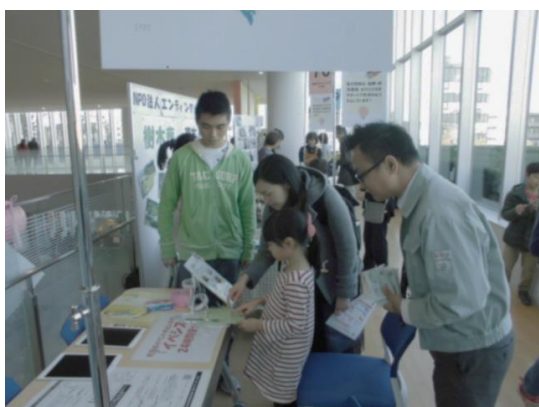
＜写真＞屋上花畑運営サポーター活動の様子 右上：サポーター会議の様子 左上・左下：まちカフェの様子