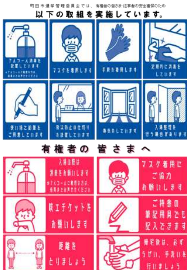
【投票所に掲示したポスター】