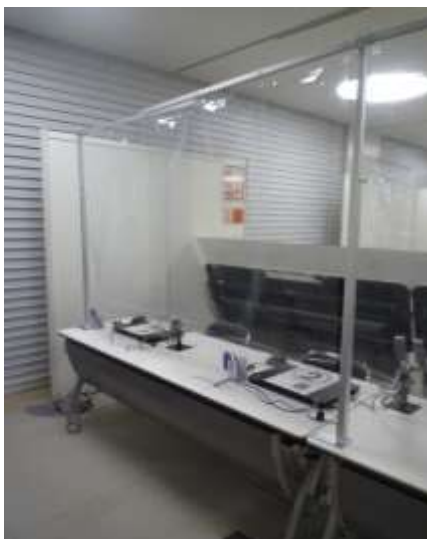
【飛沫防止カーテン】