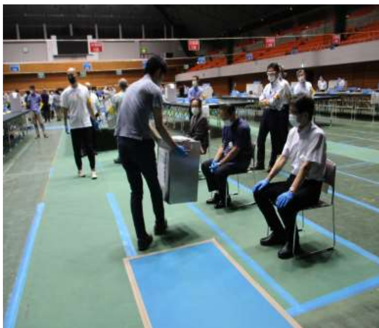
【マスク・手袋を着用し作業する様子】