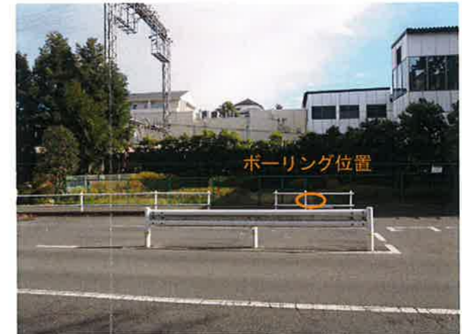
ボーリング計画位置の全景