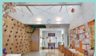
ボルダリングに挑戦!