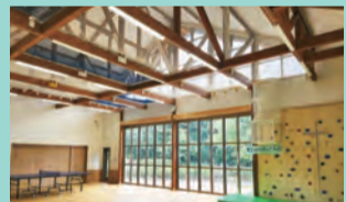
天空のハンモックで遊べるよ