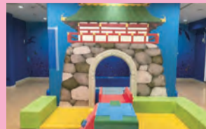
絵本の世界へようこそ