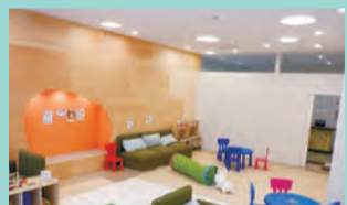
グランベリーパークの中にあるよ