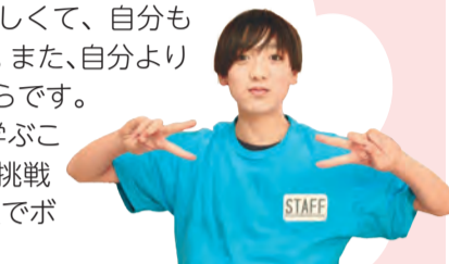
きそっち子ども委員会 わくさん (小学6年生)

子ども委員会に入ったきっかけは、子ども委員会が企画していた夏まつりが楽しくて、自分もやってみようと思ったからです。また、自分より年下の子とも関わりたいからです。実際に入ってみると、いろいろ学ぶことができ、興味があることに挑戦できます。きそっちでは、遊戯室でボール遊びをするのが好きです。