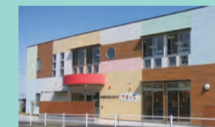
カラフルな建物がお出迎え