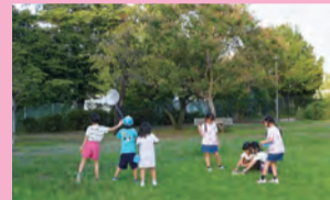
ひろーい芝生ひろばで遊べるよ