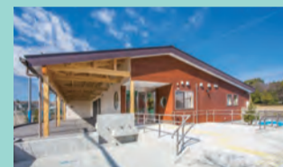
大きなテラスでのんびり過ごせるよ