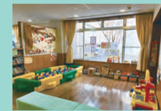
ボールプールで遊べるよ