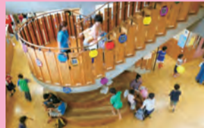
木のぬくもりの中で、のびのび遊ぼう!