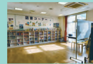
コンパクトでアットホーム