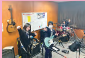
スタジオで未来のミュージシャン