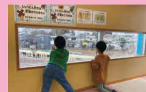
町田駅近く! 電車が見えるよ