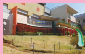
大きなペリ台が人気!