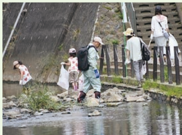
原町田親水広場会場での清掃活動

いよいよ来年の4月からは、市内全域で容器包装プラスチックの分別収集・資源化が始まります。市民の皆さんのご協力を重ねてお願いします。