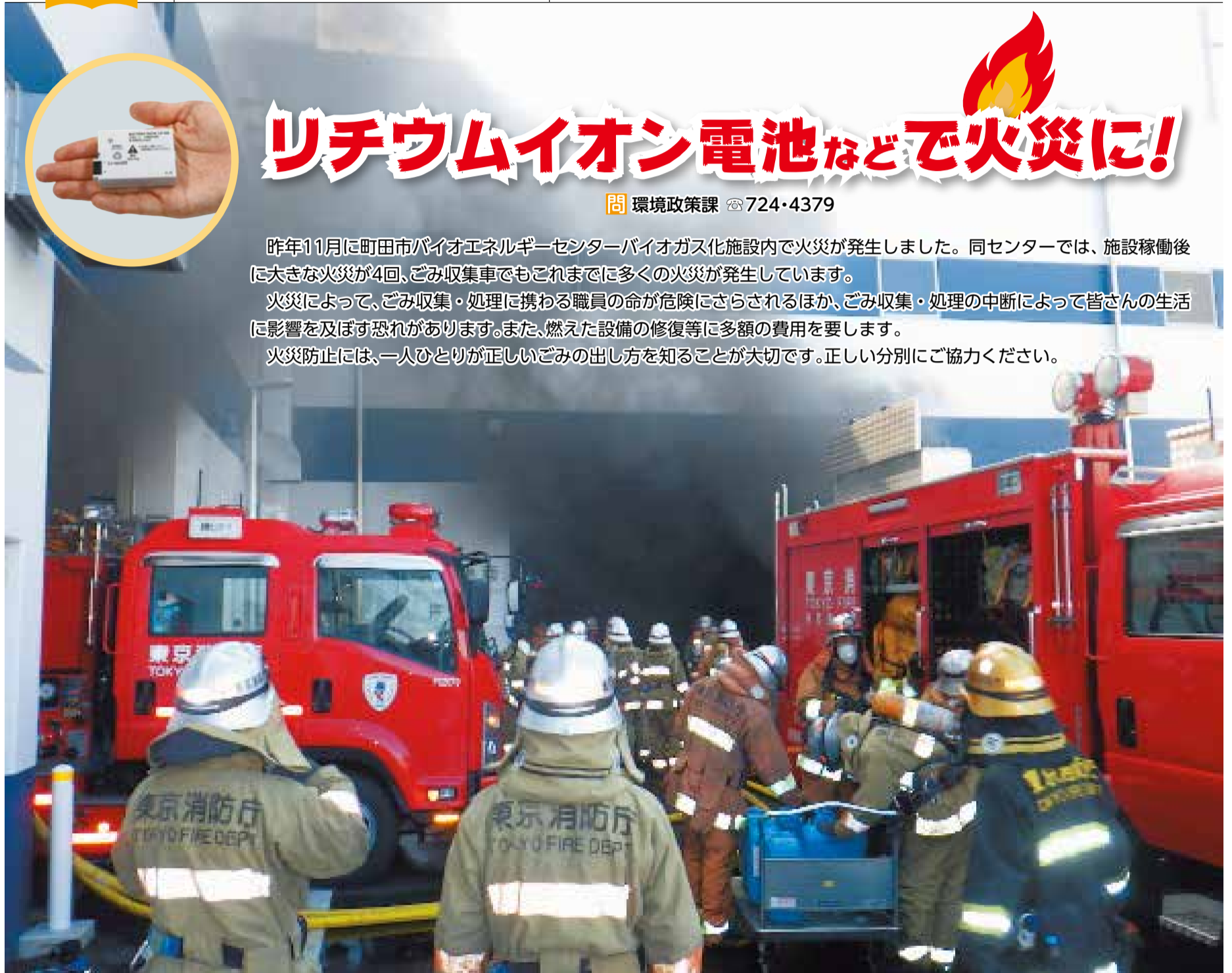
同センター工場棟の火災の様子(2022年2月21日発生)

火災防止には、一人ひとりが正しいごみの出し方を知ることが大切です。正しい分別にご協力ください。