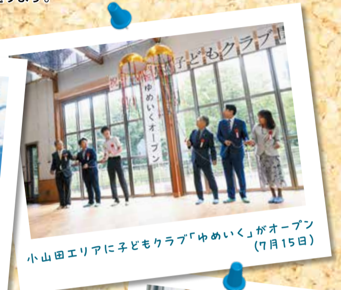
小山田エリアに子どもクラブ「ゆめいく」がオープン (7月15日)