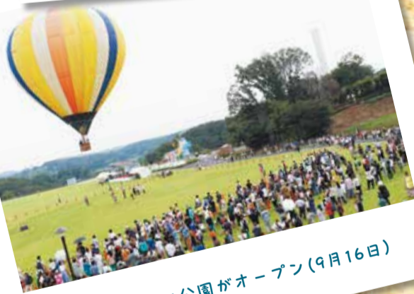
忠生スポーツ公園がオープン(9月16日)