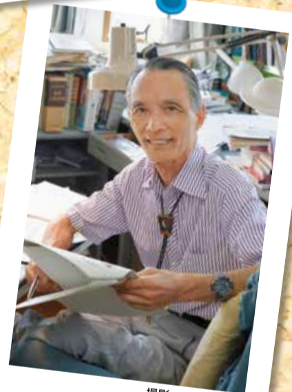
名誉市民の森村誠一氏が 逝去(90歳)(7月24日)