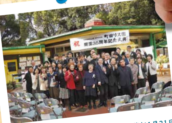
町田リス園開園35周年記念式典を開催(11月21日)