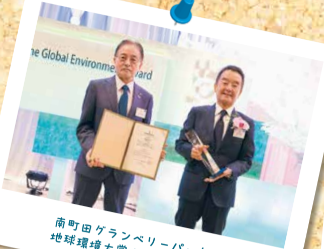
南町田グランベリーパークが 地球環境大賞を受賞(3月1日)