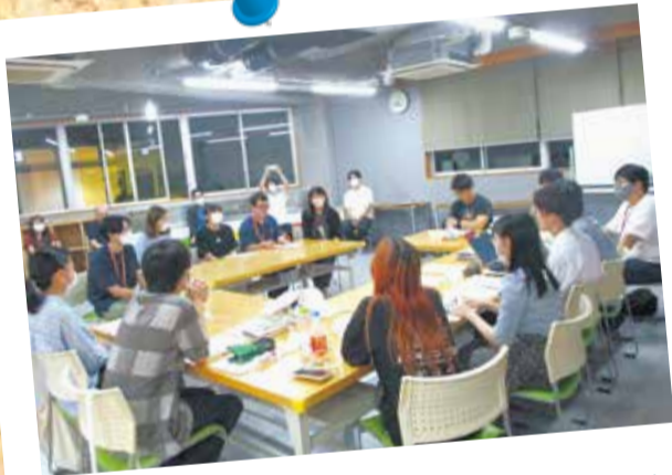
まちだ若者大作戦のエントリーが開始(5月15日)