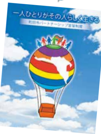
町田市性の多様性の尊重に 関する条例が施行(4月1日)