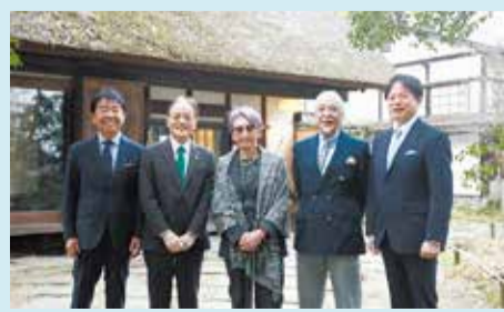
旧白洲邸 武相荘の(株)こうげいと連携協定締結(3月9日)

今年も事業者の皆さんのご協力のもと、子育て・障がい者・高齢者支援や地域貢献活動、災害、環境、観光情報などに関する多くの協定を締結しました。