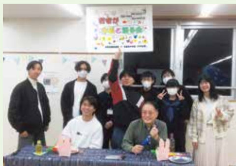
若者が市長と語る会(子どもセンターつるっこ)

条例案の策定過程では、「町田市子ども・子育て会議」を始め、多くの皆さんに加わっていただきましたが、特に、この条例の各条項に先立つ、「前文」の表現については、中学生、高校生、大学生にも意見を聴きながらまとめています。議決されれば、来年5月5日のこの日(日)が条例施行日になります。市民のみんなが、子どもにやさしいまちの実現にともに努力をしていくまちになることを願っています。