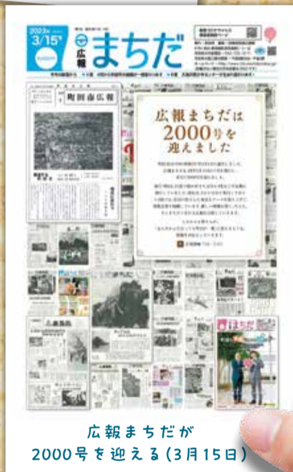
広報まちだが 2000号を迎える(3月15日)