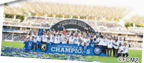
FC町田ゼルビアのJ2優勝・J1昇格が決定 (10月22日)