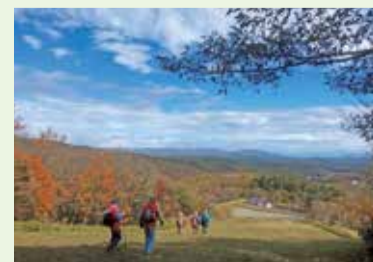
フットパスの風景(甲子高原)

さて、FC町田ゼルビアがJ2リーグ優勝を果たしました。初のJ1昇格です。本当におめでとうございます。西郷村での全国フットパスの集いと日程が重なって観戦できませんでしたが、先月29日のホーム最終戦には町田GIONスタジアムで過去2番目に多い観客が詰めかけ、大変な盛り上がりを見せました。来季、J1リーグでのFC町田ゼルビアの活躍を期待しています。というより、必ずJ1リーグのトップを争うことになるかと確信しています。市民の皆さんのさらなる応援をお願いします。