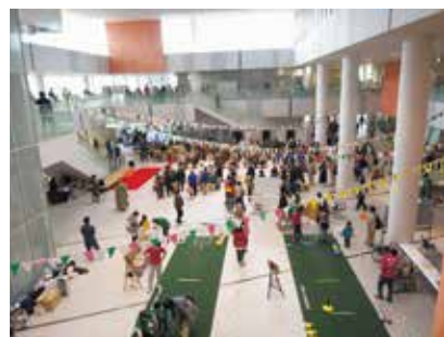
2022年度のオープニングイベントの様子

今年度は市庁舎でオープニングイベントを過去最大の参加団体数、企画数で実施します。なお、開催期間中には市内各地の会場でもイベントを行う予定です。環境、まちづくり、福祉、子育てなど市内のさまざまな情報を楽しみながら知ることができる「まちカフェ!」にぜひおいでください。