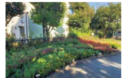
Peace Road MachiYoko