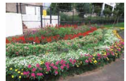
三ツ目山公園 はなみずきの会