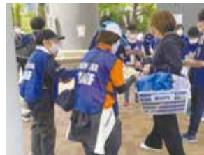
まちサポも一丸となってチームを応援しています!

FC町田ゼルビア(サッカー)・ASVペスカドーラ町田(フットサル)のホームゲーム開催時に、受け付けや会場内の誘導などを担い、ホームタウンチームの円滑な試合運営を支えています。