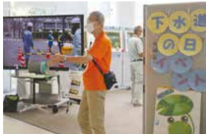
イベントスタジオ(市庁舎1階)で行われるイベントのサポートも行っています。