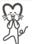
公共施設見直しキャラクター まちにゃん

納め忘れのないようお気を付けください 8月は「市・都民税、国民健康保険税」の支払い月です