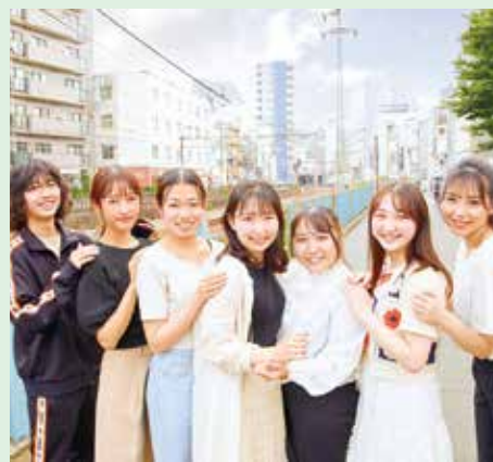
クリップ(保存)しておきたい町田の情報を詰め込んだWEBメディア「マチダクリップ」の皆さん

町田発の口コミサイトを立ち上げようと思ったきっかけは?学生の皆さんはどのように記事を書いているの?記事を制作している現場にお邪魔してきました。