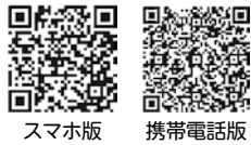
スマホ版 携帯電話版