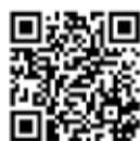
▲ 遠藤周作生誕100年記念展

町田GIONスタジアムに現在設置している水銀灯の生産終了に伴い、夜間照明をLED化することで、プレーする選手を始め、観戦・応援