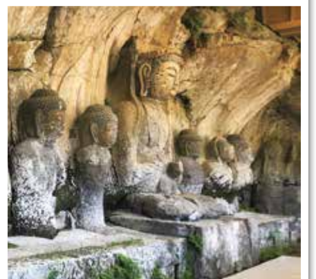
国宝臼杵石仏(古園石仏)

来年の開催地は、福島県西白河郡西郷村に決まりました。全国でも「村」に新幹線の駅(新白河駅)があるのはここだけです。新型コロナウイルスの感染が終息に向かえば、こうした、特に観光地として発展してきた市町村でなくとも、人々が訪れる、フットパスのような着地型観光の流れが進んでいくものと思われます。町田市としても、そうした事例に学びながら、来訪者を増やし、交流を深めていきたいと思っています。