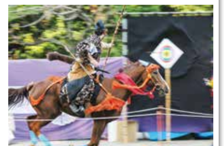
町田時代祭りの流鏑馬

当面は、ウィズコロナ、コロナとの共存の形ですが、市民・企業の皆さんとともに、地域経済の活性化と市民生活の安心・安定に向けて市政を進めていきたいと思ひます。