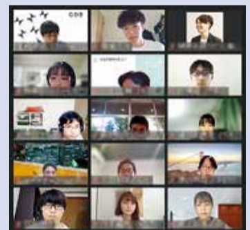
創業スクール授業風景

「自分のアイデアをビジネスの形にしてみたい」「ビジネスについて詳しく学んでみたい」「何か新しいことにチャレンジしてみたい」という方におすすめです。