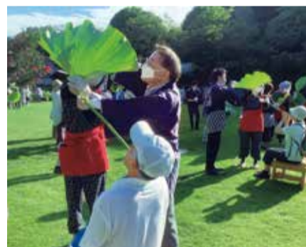
荷葉酒、荷葉茶のおもてなし