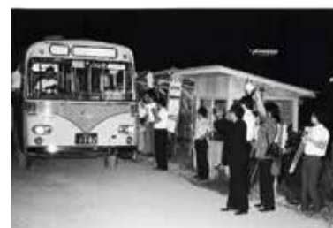
日本初の深夜バス

バスは市民の暮らしに不可欠な移動を支えながら地域とともに発展し、現在では市内で100以上の路線が走っています。