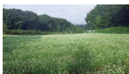
白い花が一面に広がるそば畑