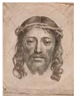
49年、クロード・メラン(聖顔)の版画「エンジェル・ヴィンク」(部分) 町田市立