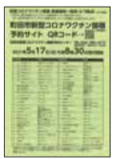
⑥接種実施場所一覧表