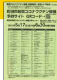
接種実施場所一覧表

市内の約130か所の病院・診療所で接種を受けることができます。 接種を受けることができる医療機関については、接種券に同封されている緑色のチラシ「接種実施場所一覧表」をご覧ください。