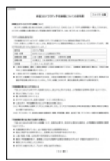
⑤接種についての説明書