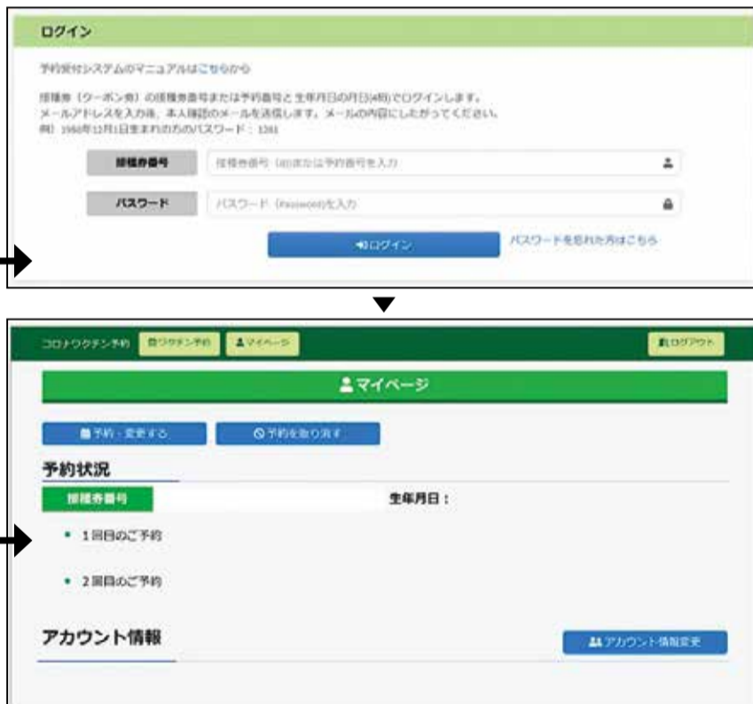
〈マイページの表示画面への遷移〉

※この画面では、接種の予約は完了していません。引き続き「 ステップ2 接種日を予約する 」に進みます。