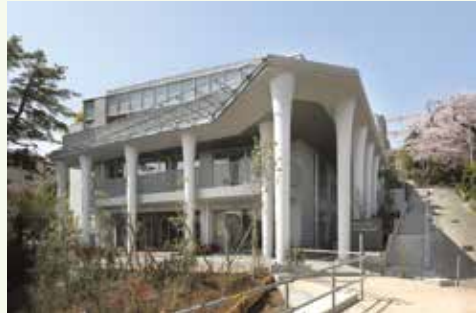
新しい玉川学園コミュニティセンター

ホールや多目的室の集会施設は、5月22日午後1時から貸し出しを再開します。また、玉川学園駅前連絡所の行政窓口及び児童図書室は、5月24日から開所します。