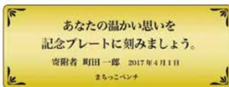
記念プレートの見本

申込書(町田市ホームページでダウンロード、または公園緑地課(市庁舎8階)で配布)に必要事項を記入のうえ、直接公園緑地課へ。