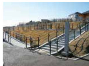
整備された入り口