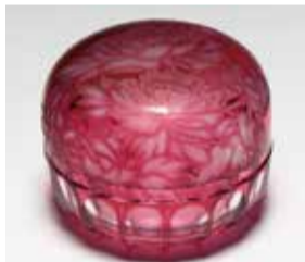
青野武市 金赤牡丹文蓋物 2002年