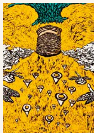
山口柚佳《new apartment area》(名古屋芸術大学) ※昨年度受賞作のため、今年は出品されません。