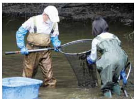
真光寺地区 池の「生物調査」の様子