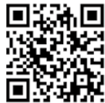
南町田拠点創出まちづくりプロジェクトホームページ

官民一体で取り組んだシームレスなまちの構造や、質の高い空間整備が高く評価され、市内で初めての大賞受賞となりました。