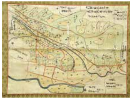
「能ヶ谷村絵図」(寛保3(1743)年10月)