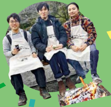
◆FIRE MEETING #0の様子