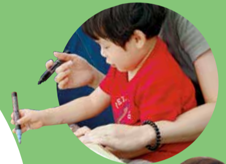
▲親子の花の ▼芸術祭の様子