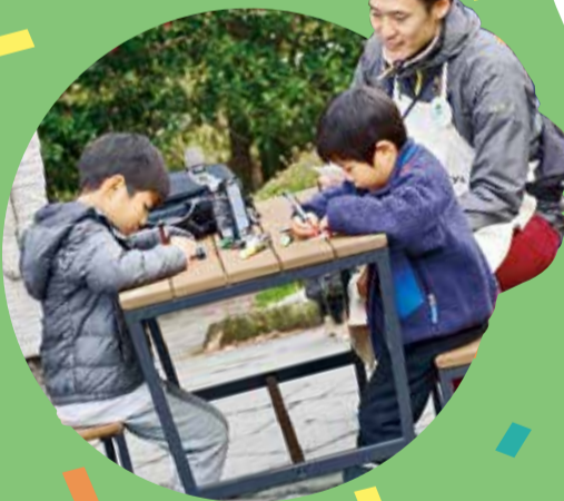
▶桜美林大学芸術文化学群と共催で行ったライトアップイベント