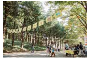
過去のがっこう祭の様子

新しい公園を楽しく活用するアイデアを一緒に実現し、盛り上げる出展者を募集します。まちのがっこう祭に出展したい、または運営に関わりたい、同パーク周辺で活動したい等の個人・団体の参加をお待ちしています。