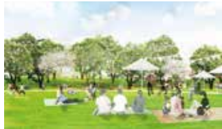
リニューアルする鶴間公園(イメージ)

新しく生まれ変わる鶴間公園の指定管理者が、TSURUMAパークライフパートナーズ〔(株)石勝エクステリア、東急スポーツシステム(株)、日本体育施設(株)〕に決定しました。市の公園としては、初めて指定管理期間を約10年間に拡大し、まちの中心メンバーの一員として、パークマネジメントに取り組みます。