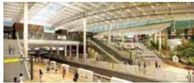
南町田グランベリーパーク駅(イメージ)

まちびらきに先立ち、10月1日(火)から、南町田駅は南町田グランベリーパーク駅に改称します。土・日曜日、祝休日などの急行停車を平日に拡大し、全日急行停車駅になります。また、つくし野駅とすずかけ台駅も全日準急停車駅になります。