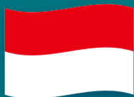
【インドネシア共和国】 空手・バドミントン ・パラバドミントン