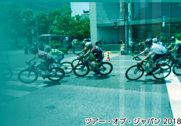
ツアー・オブ・ジャパン 2018