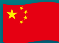
【中国】 卓球・バレーボール・ バドミントン・水泳