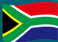
【南アフリカ共和国】 南アフリカ代表チーム