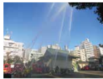
昨年の演習は町田天満宮で行われました

毎年1月26日は文化財防火デーです。火災・地震及びその他の災害から文化財を守りましょう。 ※天候等により中止の場合があります。 日 1月27日(日)午前9時から 場 圓成寺(鶴間5-17-1)