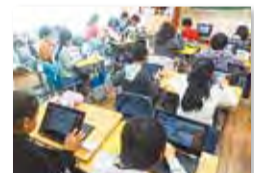
情報教育の授業風景

2018年に情報教育推進のため、小学校に電子黒板機能付プロジェクターを購入しました。