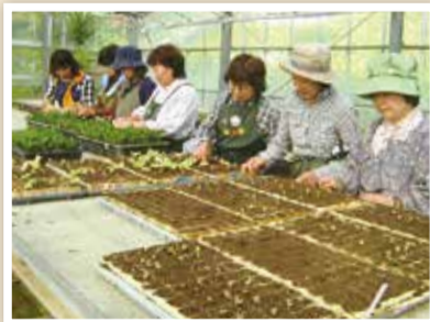
下小山田苗圃で種から育てた苗を配ります

春と秋の年2回、花壇の美しさを競います。参加希望団体には、下小山田苗圃で栽培したサルビアやビオラなどの草花苗とたい肥、化成肥料を配布します。配布期間は約1週間です。参加希望団体には日程が決まり次第、代表者の方宛てに案内を送ります。皆さんも草花苗を育て、季節感溢れる花壇づくりに参加してみませんか。