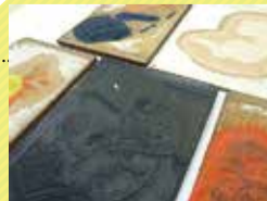
本展では版木も展示します