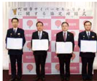
左から大嶺南大沢警察署長、深澤町田商工会議所会頭、石阪市長、岩下町田警察署長

今後、本協定に基づき、連携してサイバーセキュリティに関する広報啓発活動、サイバーセキュリティセミナーの開催、サイバー犯罪被害認知時の情報発信活動、その他サイバーセキュリティに関する必要な対応を推進します。