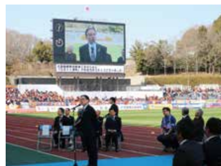
大型映像装置の除幕式

この大型映像装置が、サッカーに限らず、さまざまなスポーツイベント、文化イベントに利用されることを期待しています。