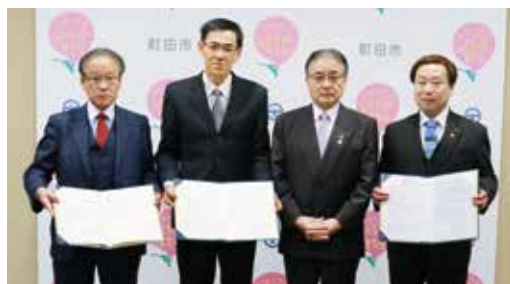
1月17日に協定を締結しました

・鶴川)から徒歩圏内に立地する物件を確保し、保育所整備を行い、待機児童を解消します。