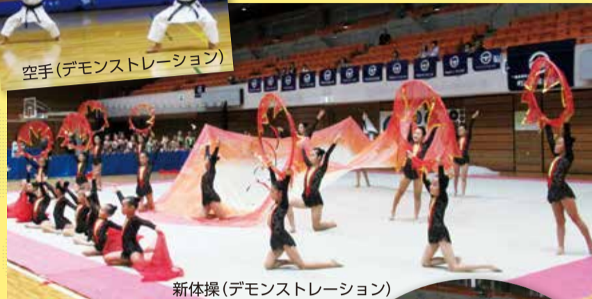
新体操(デモンストレーション)

【トライアスロン連合の自転車こぎ体験】 「水泳・自転車・長距離走」の3種目順番に連続して行う耐久競技です。競技用自転車と普通の自転車との違いを体験してみませんか?