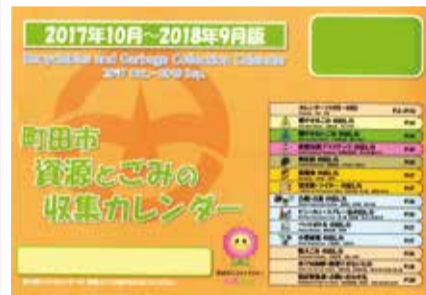
容器包装プラスチック分別収集対象地区用