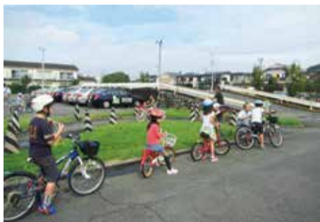
昨年度の自転車安全運転スタンプラリー