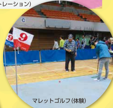
マレットゴルフ(体験)

【グラウンド・ゴルフ協会主催のマレットゴルフ体験】 スティックとボールを使用して、できるだけ少ない打数でカップインを競うスポーツです。ゴルフ初心者の方でも気軽に楽しむことができます!