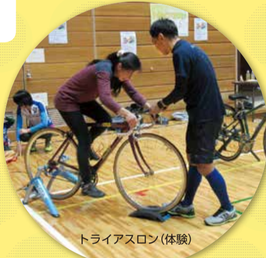
トライアスロン(体験)

【トライアスロン連合の自転車こぎ体験】 「水泳・自転車・長距離走」の3種目順番に連続して行う耐久競技です。競技用自転車と普通の自転車との違いを体験してみませんか?