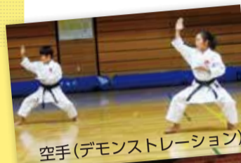
空手(デモンストレーション)