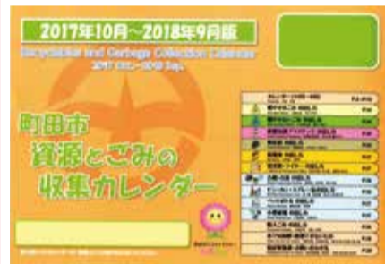
容器包装プラスチック分別収集対象地区用