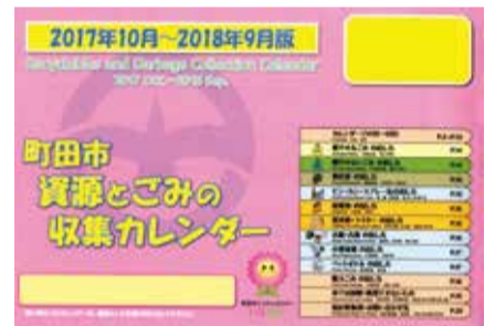
容器包装プラスチック分別収集対象地区以外の地域用