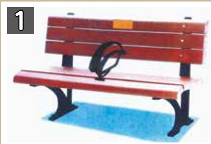
1 寄附金額 19万6560円程度