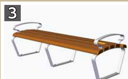
3 寄附金額 18万6000円程度