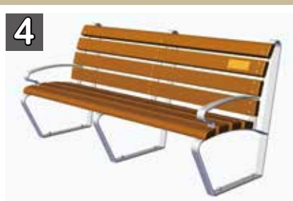
4 寄附金額 23万6000円程度