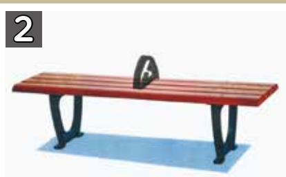
2 寄附金額 18万2520円程度