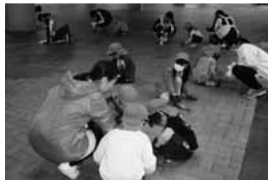
多摩境駅周辺で掃除に励む園児の皆さんと先生

現在は、壁面周辺の美化活動に関する協定を、市と同園との間で締結しており、先生や園児の皆さんが広場に捨てられたガムをはがしたり、周辺道路の清掃等の活動を行