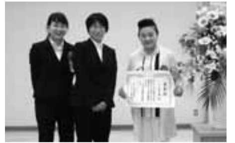
道路功労者表彰を受賞された小山保育園の先生方

町田市が実施するアダプト・ア・ロード事業（道路用地等で、市と管理協定を締結した市民ボランティア団体が清掃や園芸などの管理活動をする事業）に基づき活動する小山保育園が、9月13日に開催