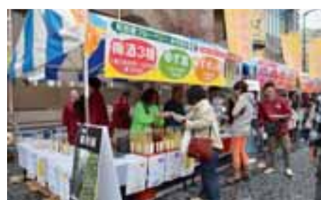
農商連携商品をお楽しみ下さい