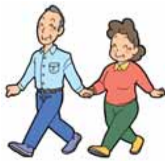
イベントに行きましょう!