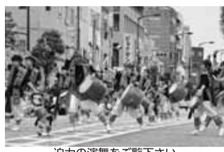
迫力の演舞をご覧ください