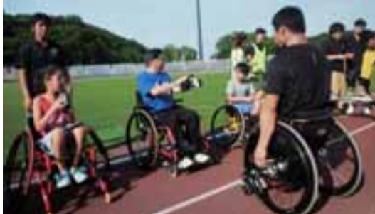
競技用車椅子を体験しました

パラリンピック大会は、選手の障がいの程度でクラス分けがあり、慣れるまでは少し戸惑うかもしれませんが、何よりも、トップアスリートの素晴らしい能力と戦いぶりをみるのは楽しいことだと思います。