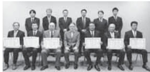
受賞された施工者の皆さんと石阪市長